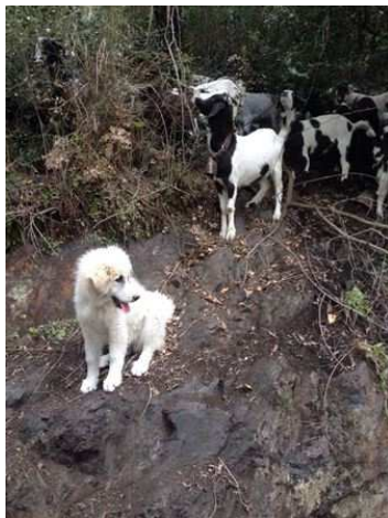
Garona de Cal Manistró

Glére de Cal Manistró a Xavier Fàbregas de Riudarenes (Selva) Catalunya.