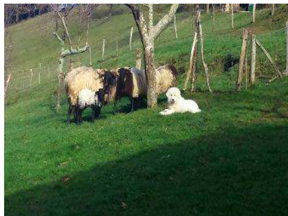
Gola de Cal Manistró