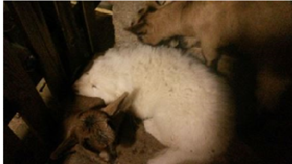
Fer de Cal Manistró