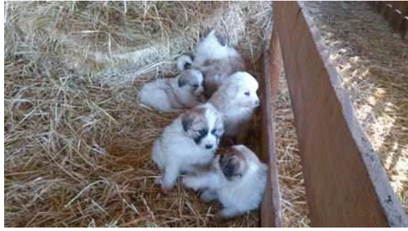
Camada G de Cal Manistró