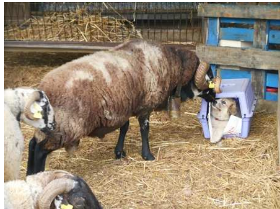
Glére de Cal Manistró