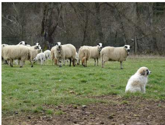
Gaula de Cal Manistró