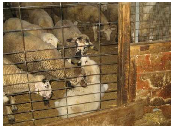
Engorgs de Ca l'Ainat

21-03-2015. Nace la primera camada de MPRs en el rebaño de "Ous Ecològics de l'Empordà" del Mas Rimbau a Cabanes en la comarca de l'Alt Empordà (Catalunya). Los padres son Artic de la Canova y Baserca de Cal Fontestà. Nacieron un macho y una hembra que se entregaron a los ganaderos siguientes: