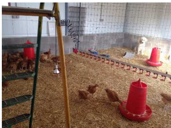
Baridana de Cal Minguet